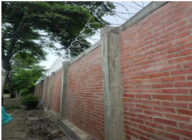
COLUMNAS Y VIGAS