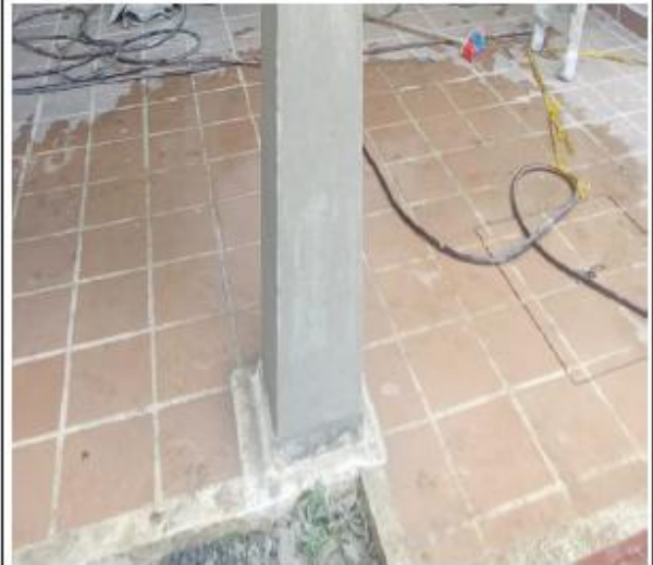
TABLON SAHARA 30.5X3